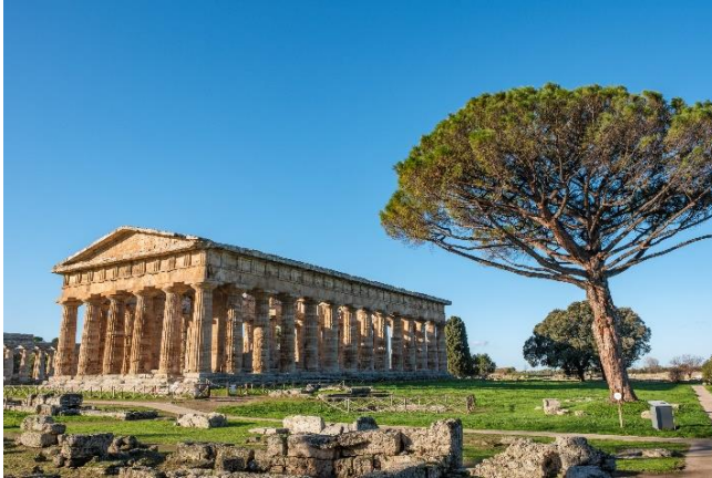
De 'Poseidontempel' (Hera II), 470-460 v.Chr.