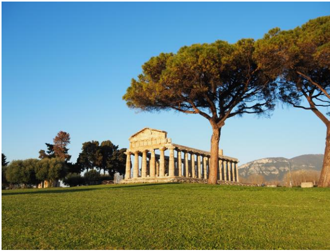
De tempel van Athena, ca. 500 v.Chr., Paestum