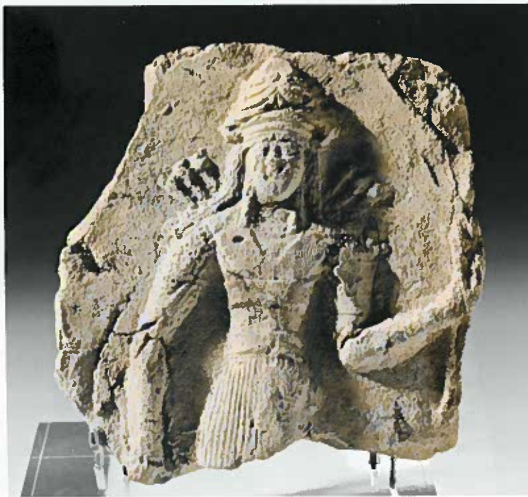
▲ Een kleipaneeltje uit het begin van het tweede millennium v.Chr. met een afbeelding van de godin Ishtar. Het voorwerp stamt waarschijnlijk uit het zuiden van Mesopotamië waar deze godin ook werd aanbeden (© RMO, A 1932/7.91).

Nineveh was een tijdlang de grootste en belangrijkste stad van de wereld. Kilometerslange muren met statige poorten omringden indrukwekkende paleizen, tempels, talloze straatjes, weelderige parken. Van hieruit werd het immense Assyrische rijk bestuurd. De stad werd al in 612 v.Chr. verwoest en was lange tijd onvindbaar voor archeologen. Met een adelaarsblik overzien we de historie van deze recent opnieuw door oorlog beschadigde hoofdstad van een wereldrijk.